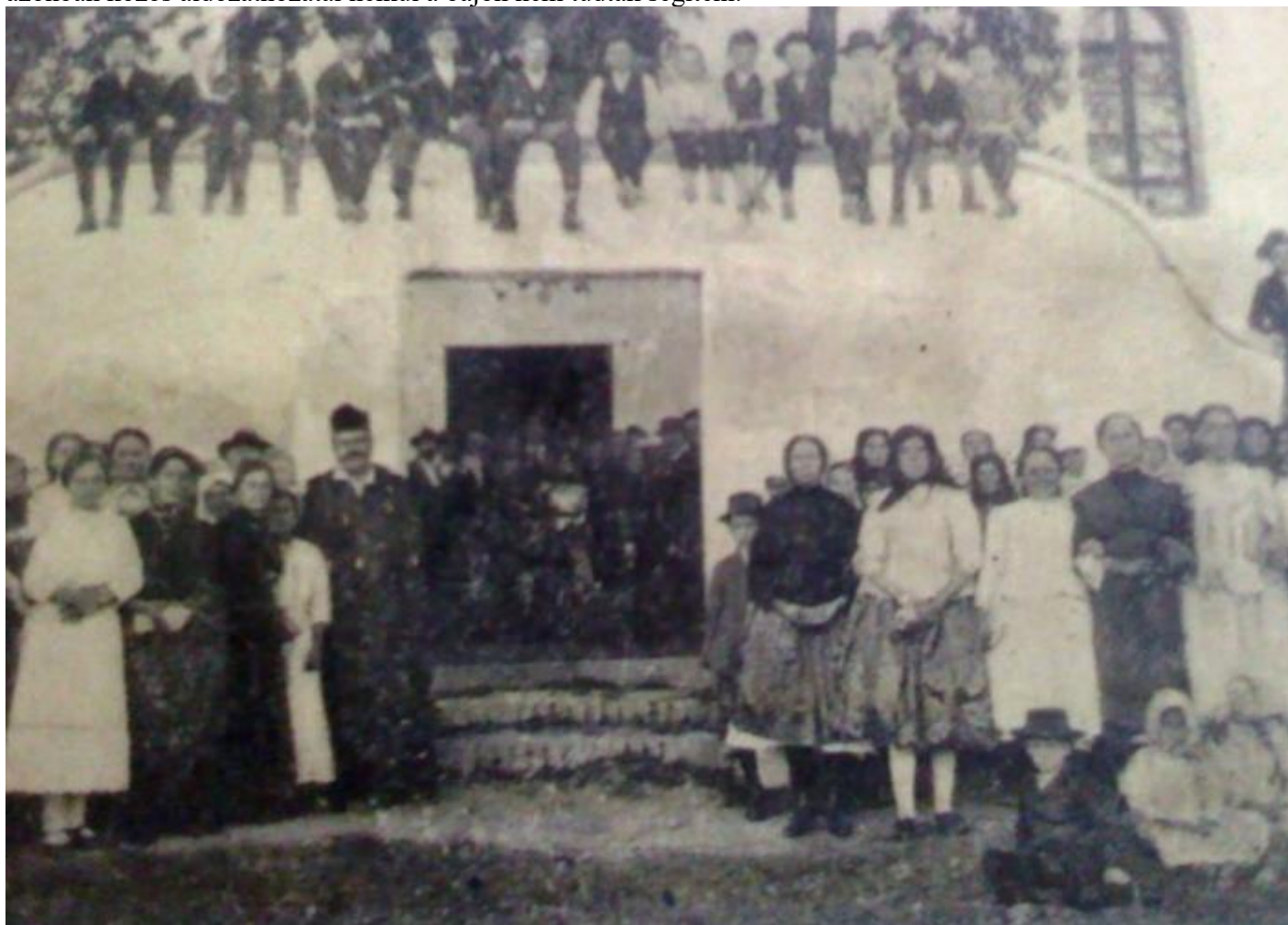
Kép: 1916, a harangot búcsúztatja Zaláta

A nagyobbik harang régebbi elődjét, mely 256 kg súlyú volt, az első világháború alatt 1916. évi augusztus hó 24-én vitték el hadi célra, közvetlen elődje pedig – mely 234 kg súlyú volt és 1922-ben ajándékozta a zaláti közbirtokosság – 1945. évi augusztus hóban megrepedt. Pusztulása, halála fájt mindnyájunknak és úgy megsirattuk, mintha valamelyik drága szerettünket veszítettük volna el. Hiányzott a hangja, nélküle szinte üres lett a falu, egyházunk istenfélő tagjai azonban közös áldozathozatal nélkül a bajon nem tudtak segíteni.